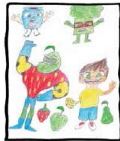
E.E. PROFESSORA MARIA ONDINA ANDRADE RICHARD OLIVEIRA