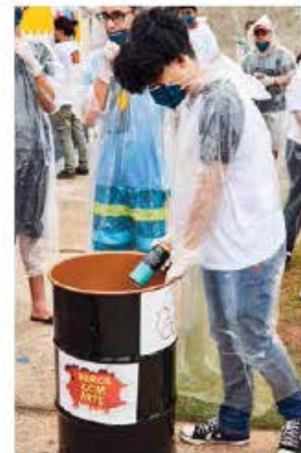
MUROS COM ARTE - SOROCABA