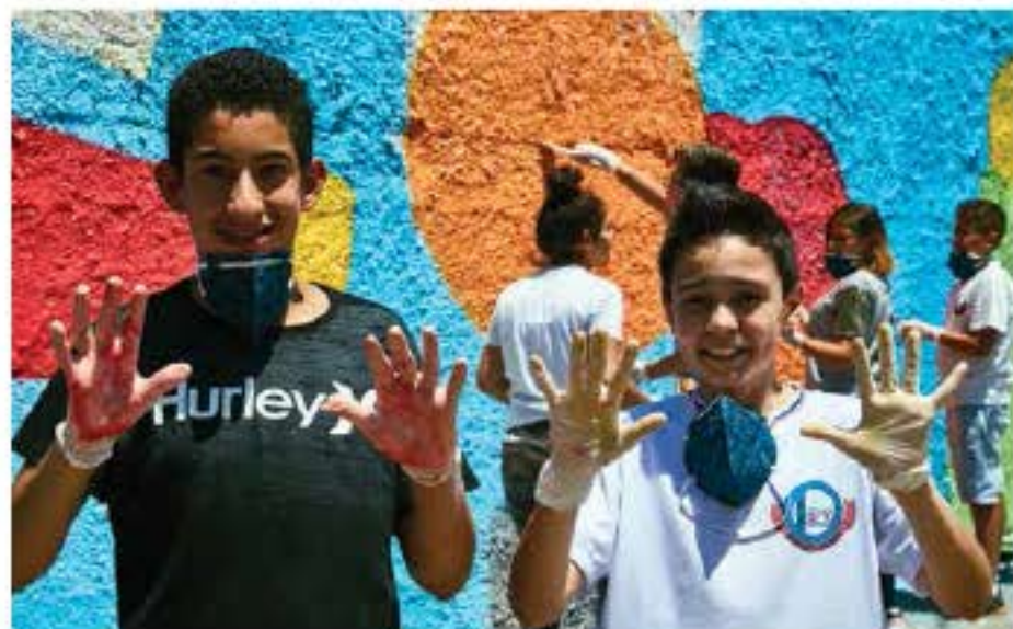
MUROS COM ARTE - SOROCABA